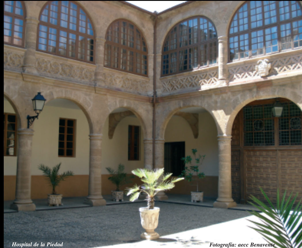
Hospital de la Piedad